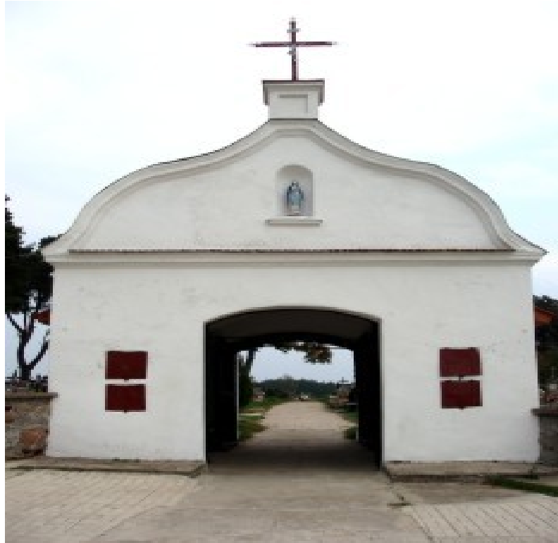
Fotografia nr 4. Lamus w Kalinówce Kościelnej