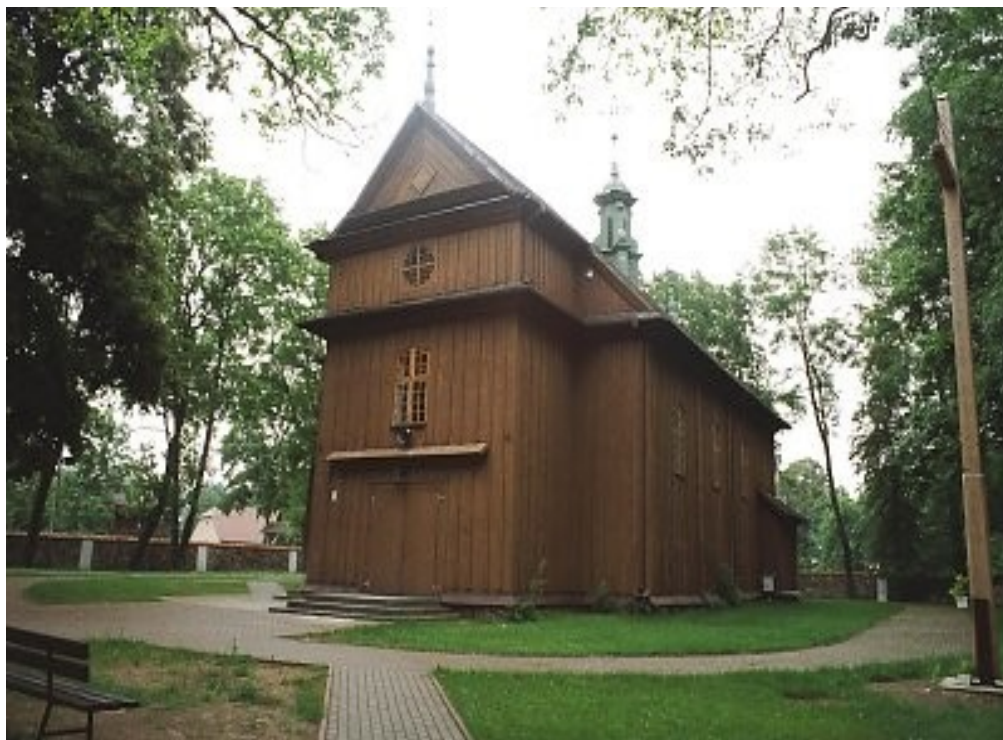
Fotografia nr 3. Brama cmentarna w Kalinówce Kościelnej